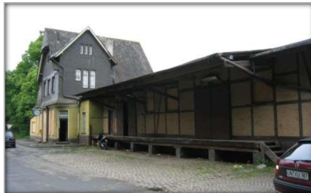
Empfangsgebäude vor Sanierung und Entwicklung