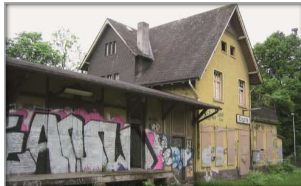
Außenansicht vor Sanierung und Entwicklung

Die Stadt Schwerte hat im Jahr 2006 über die BEG NRW Teilflächen in einer Größenordnung von circa 3.600 Quadratmetern der alten Ladestraße für zwei Maßnahmen erworben. Mit Hilfe der Landesförderung NRW wurde eine P&R-Anlage für 34 Stellplätze mit neuen Zugängen zum Bahnsteig hergerichtet. Als zweite Maßnahme finanzierte die Stadt Schwerte den Bau einer Fuß- und Radwegeverbindung.