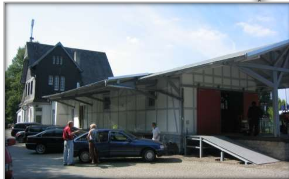
Empfangsgebäude nach Sanierung und Entwicklung

Carsten Kirchhoff Tel.: 0201 / 747 66-0; E-Mail: carsten.kirchhoff@beg.nrw.de www.beg-nrw.de