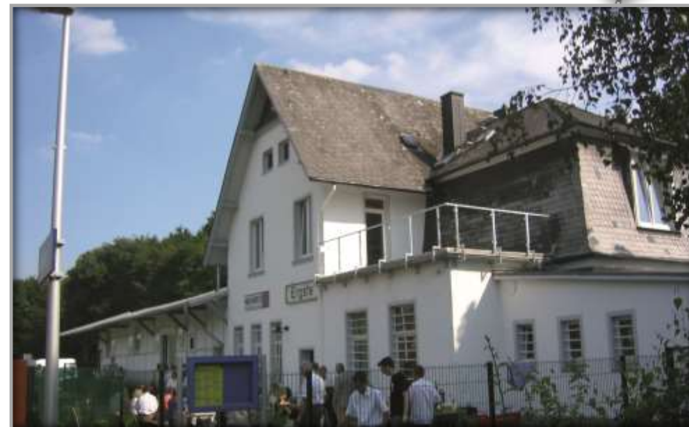
Außenansicht nach Sanierung und Entwicklung

Die Firma Hermes Technologie GmbH&Co. erwarb Ende 2003 das Gebäude. Ihr Ziel war der Umbau des Gebäudes zu einem repräsentativen Firmensitz. Böden, Wände und Decken wurden instand gesetzt. Die Grundrisse angepasst. Die Güterhalle wurde als Präsentations- und Lagerraum für die Produkte der Firma hergerichtet. Die Außenhülle wurde grundlegend instand gesetzt, unter anderem durch umfangreiche Reparaturen an der ursprünglichen Dacheindeckung, durch die Sanierung der Fassade sowie der meist maroden Fenster und Türen. Das Empfangsgebäude erhielt einen neuen hellen Anstrich und die Außenanlagen wurden zudem neugestaltet.