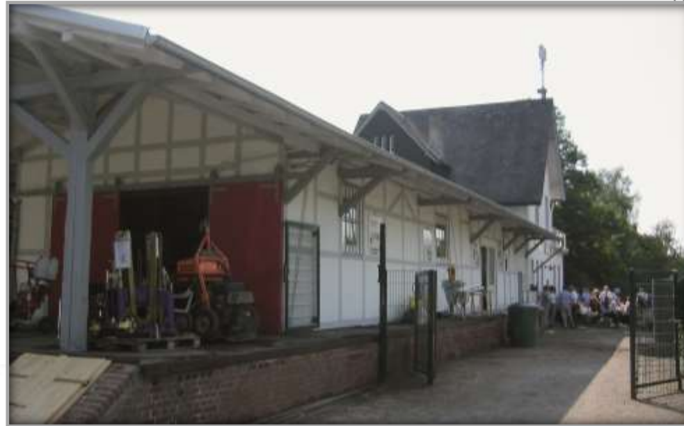
Lagerhalle nach Sanierung und Entwicklung